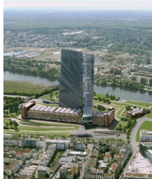
Der Entwurf von COOP HIMMELB(L)AU für den Neubau der EZB.