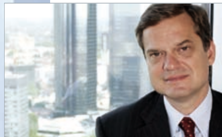
LORENZO BINI SMAGHI MITGLIED DES DIREKTORIUMS DER EUROPÄISCHEN ZENTRALBANK

es freut mich sehr, Ihnen die erste Ausgabe unseres Newsletters zum EZB-Neubau präsentieren zu dürfen. Mit diesem Informationsblatt möchten wir Sie in regelmäßigen Abständen – etwa dreimal im Jahr – über die Fortschritte des Neubaus zu informieren.