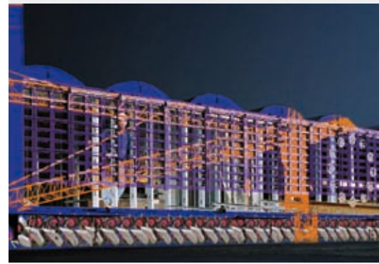
Ab dem 6. April 2008 um 20.30 Uhr wird die ehemalige Großmarkthalle im Rahmen der Luminale 2008 von den Tübinger Lichtkünstlern Casa Magica in Szene gesetzt.

Ende des Jahres 2011 plant die EZB, ihren neuen Sitz im Frankfurter Ostend zu beziehen.